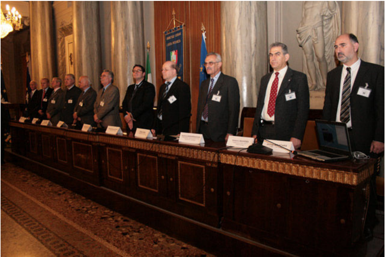
Nach den geleisteten Unterschriften erklingen die einzelnen Nationalhymnen und, abschliessend, die Europahymne