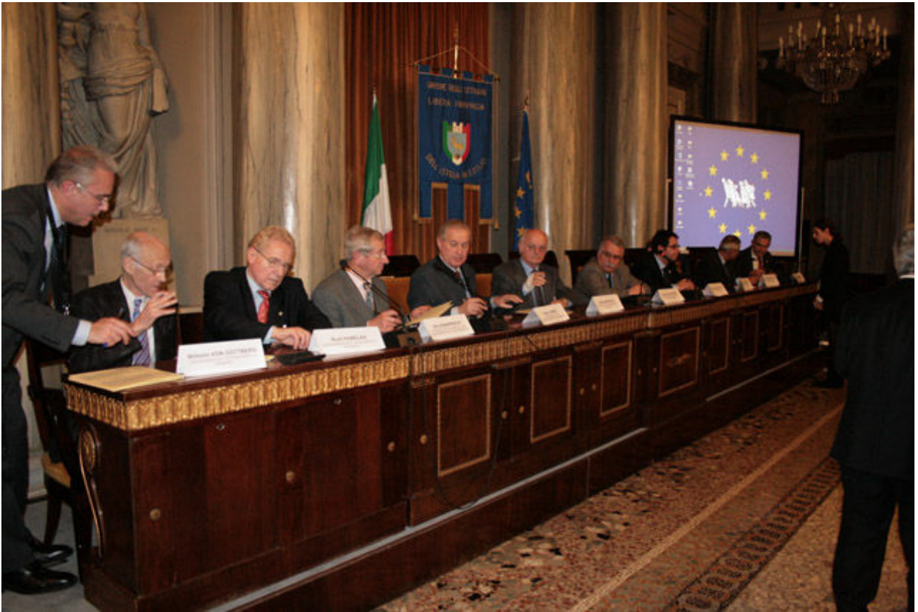
Nach den Wahlen der Amtsträger bereiten sich die Vertreter der elf Gründerorganisationen vor, jede einzelne Seite des Statuts in italienischer, deutscher und englischer Fassung zu unterzeichnen