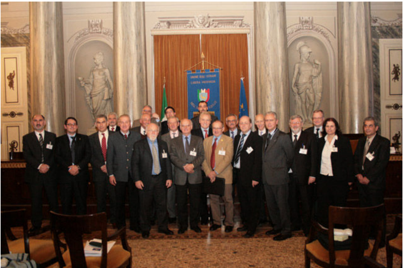
Gruppenfoto der Vertreter der elf Gründerorganisationen