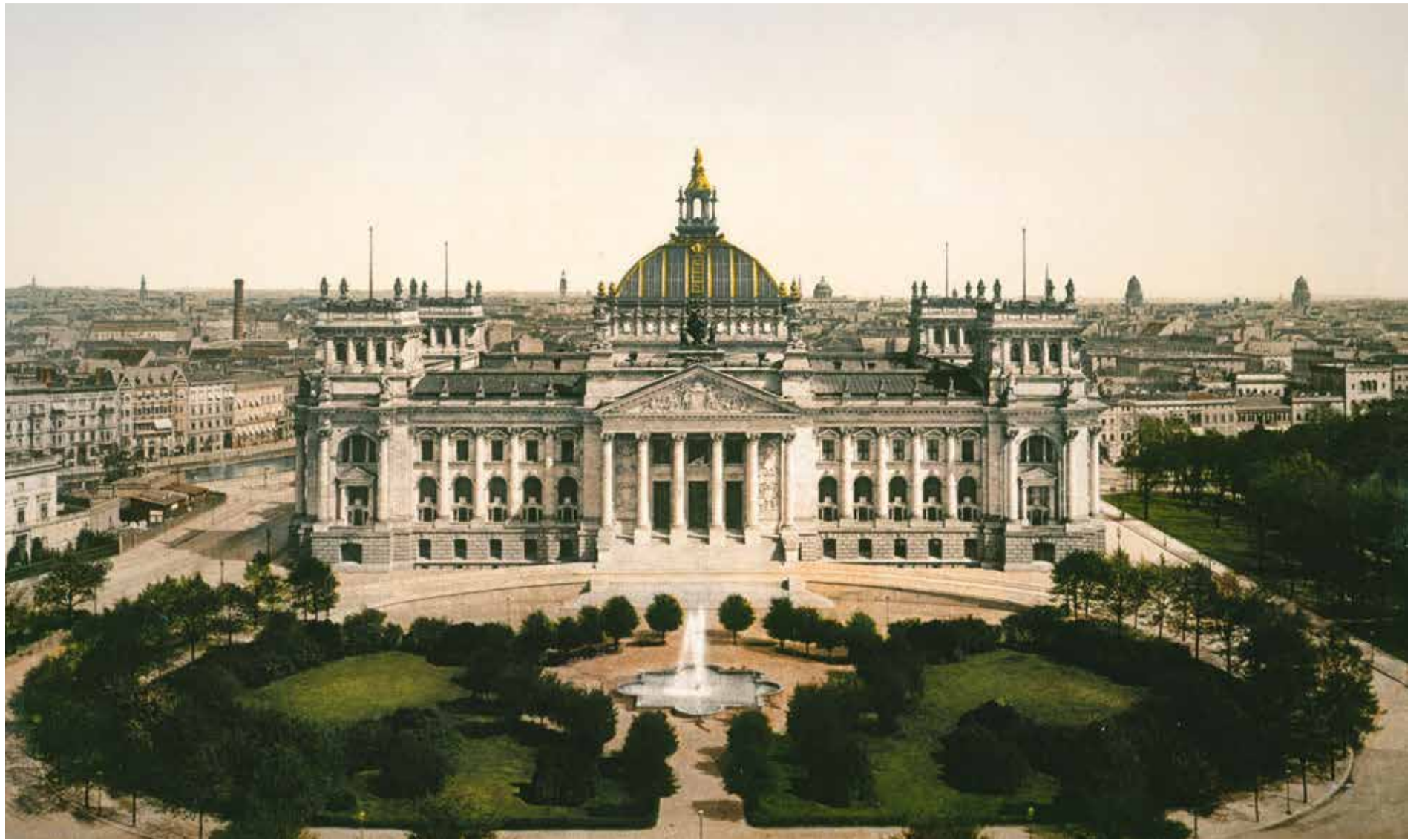
Symbol der staatlichen Kontinuität zwischen dem Kaiserreich und der Bundesrepublik: Der von Paul Wallot erbaute Reichstag in Berlin

Sogar die Umstände, die diese Konstellation entstehen ließen, waren ähnlich. Die Reichsgründung von 1871 war keine ausschließlich deutsche Angelegenheit. Andere Europäer in anderen Ländern haben dazu, dass sie möglich wurde, ebenfalls ganz wesentlich beigetragen – durch das, was sie taten, oder auch durch das, was sie unterließen. In dieser Hinsicht gibt es ebenfalls Parallelen zwischen 1871 und der Vereinigung von 1990. In beiden Fällen stand eine angelsächsische Weltmacht dem Einigungsprozess wohlwollend gegenüber. In beiden Fällen war die östliche Flügelmacht Europas, Russland, anderweitig und vor allem mit sich selbst beschäftigt. Die zwei wichtigsten anderen europäischen Mächte – Frankreich und Österreich 1871, Frankreich und Großbritannien 1990 – lehnten die deutsche Einigung zumindest anfangs eher ab, ohne sie freilich verhindern zu können. Sie arrangierten sich dann aber wenigstens teilweise – wie Österreich nach 1871