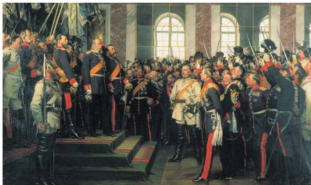
Kaum noch im Kollektivgedächtnis der Deutschen vorhanden: Die Ausrufung Wilhelms I. zum Deutschen Kaiser am 18. Januar 1871. Im Bild die erhaltene Friedrichsruher Fassung des Gemäldes von Anton von Werner

In schwierigen Lagen standen die Idee des Nationalstaats und der Reichsmythos zumeist gegeneinander, wie im Spätherbst 1918, als der Kaiser ging und die Nation blieb