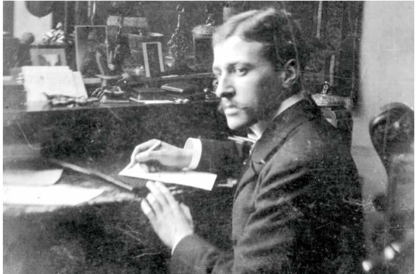
In Wien geboren, in Berlin und Dresden uraufgeführt: Wie viele österreichische Intellektuelle überquerte auch der Schriftsteller Hugo von Hofmannsthal die nach 1871 entstandenen politischen Grenzen mühelos

Denn die meisten Ungarn, Böhmen, Kroaten und so weiter lernten die Vorteile schätzen, die mit dem Gebrauch der deutschen Sprache und der Kenntnis anderer Umgangssprachen in Österreich-Ungarn verknüpft waren. Die „Reichsdeutschen“ sahen es nicht anders. Schließlich war die Donau-Monarchie ihr