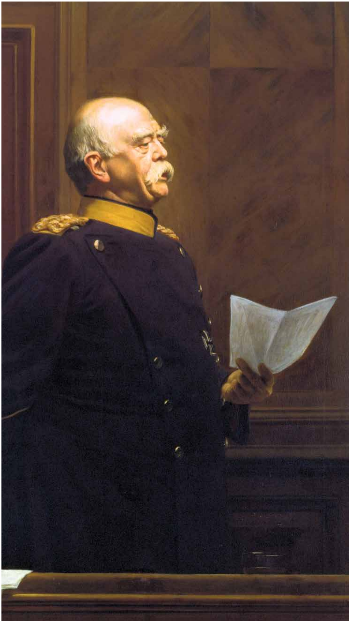
Architekt des Kaiserreichs und Konstrukteur eines Monarchenamts, das ganz auf Preußen zugeschnitten war: Der preußische Ministerpräsident und erste Reichskanzler Otto v. Bismarck. Im Bild das Gemälde „Fürst Bismarck am Bundesratstisch, eine Rede haltend“ von Anton von Werner (um 1888)

Wie limitiert die Stellung war, die die Verfassung ihm gab, wird deutlich, wenn wir bedenken, welche Rechte ihm im Vergleich zu einem monarchischen Souverän fehlten. Als Referenzpunkte bieten sich die beiden Institutionen an, die aufs Engste mit seinem Amt beziehungsweise dessen Entstehungsgeschichte verflochten waren: das Königtum in Preußen, mit dem der Kaiser in Personalunion verbunden war, und das Kaisertum der Frankfurter Paulskirche, das gewissermaßen als sein historischer Vorgänger allen Parteien bei den Verhandlungen über seine verfassungsrechtliche Position vor Augen stand. Die preußische Verfassung von 1850 erklärte unmissverständlich, dass „dem Könige allein [...] die vollziehende Gewalt“ zustehe. Der Verfassungsentwurf der Frankfurter Nationalversammlung ging sogar noch einen Schritt weiter. Er be-