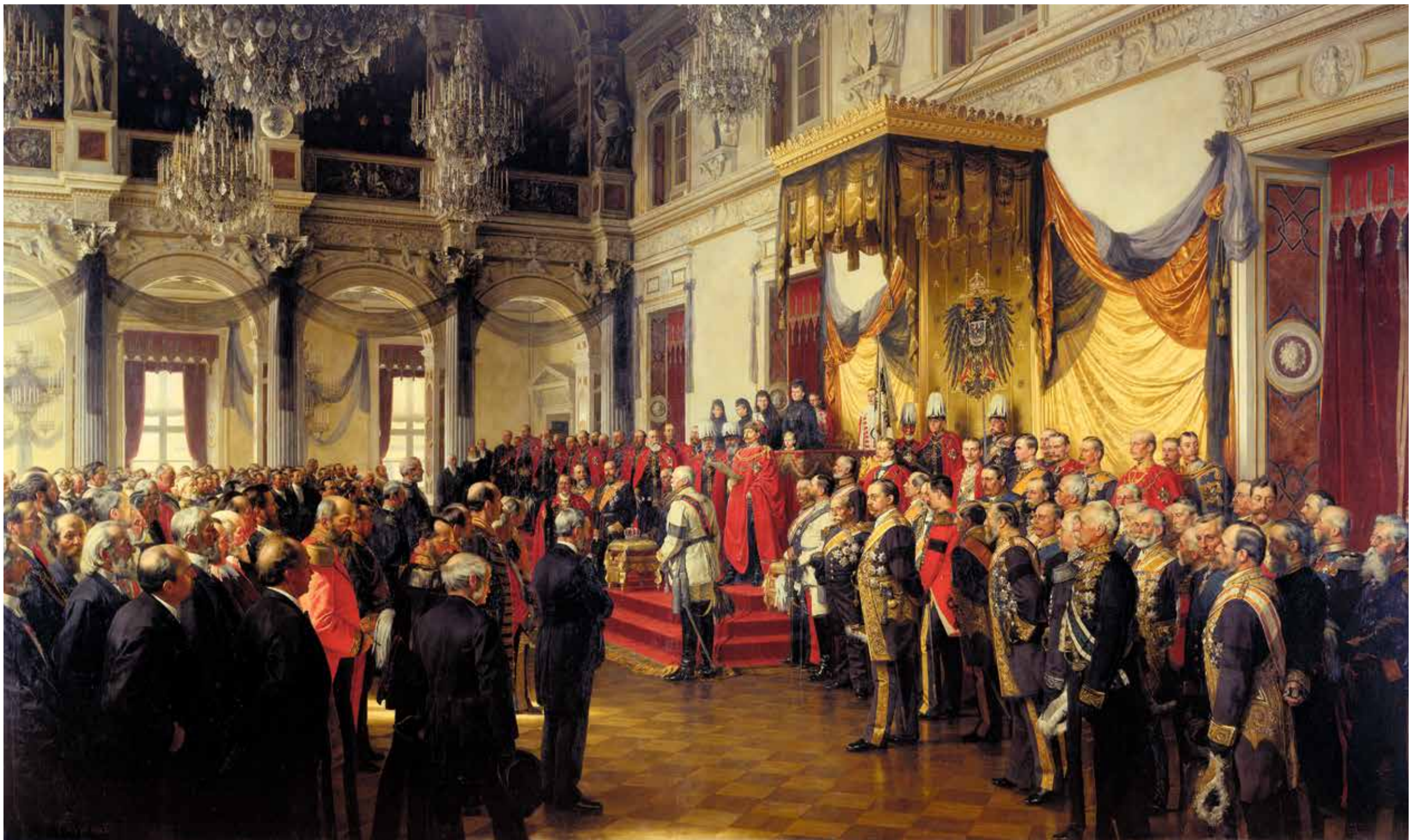
Auch in den Jahrzehnten nach der Reichsgründung hatte das Amt des Deutschen Kaisers im Vergleich zu anderen Monarchien weniger Kompetenzen. Das Bild zeigt die „Reichstagsöffnung im Weißen Saal des Berliner Schlosses durch Wilhelm II., 25. Juni 1888“ (Gemälde von Anton von Werner, Öl auf Leinwand, 1893)

Auszeichnungen monarchischen Landesherren vorbehalten waren, konnte er sie nur als König von Preußen vornehmen. Um ausdrücklich auf die ganze Nation bezogene Ehrungen durchführen zu können, schuf Wilhelm I. deshalb wenige Monate nach der Reichsgründung in Erinnerung an die Einigungskriege per Allerhöchster Ordre eine neue Version der III. und IV. Klasse des Königlichen Kronen-Ordens. Dieses kreuzförmige Abzeichen verlieh der König von Preußen an einem weißen, sechs Mal schwarz gestreiften Ehrenband, das durch seine roten Seitenränder an die Reichsflagge erinnerte. Ein besseres Sinnbild für die doppelte Identität des Kaisers hätte es kaum geben kön-