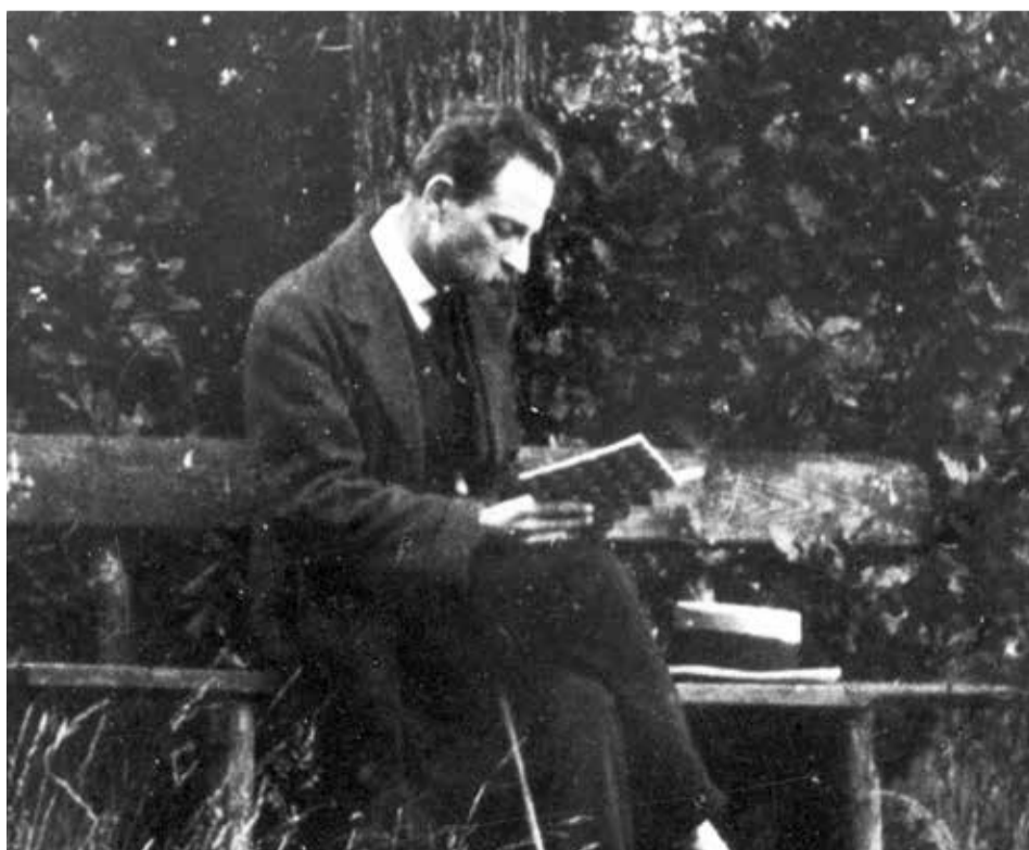
Auch Rainer Maria Rilke gehörte – wie viele andere Prager Autoren – zu den führenden deutschen Intellektuellen im späten 19. und frühen 20. Jahrhundert